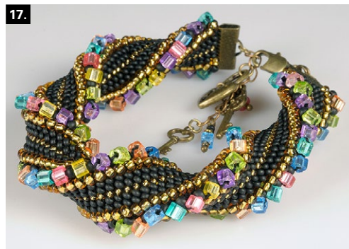
DESIGNÉRKA ALEKSANDRA LYSENKO