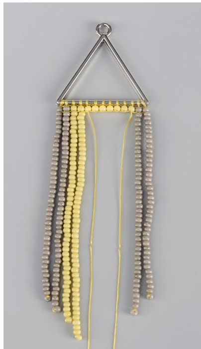
vynechání spodního R3